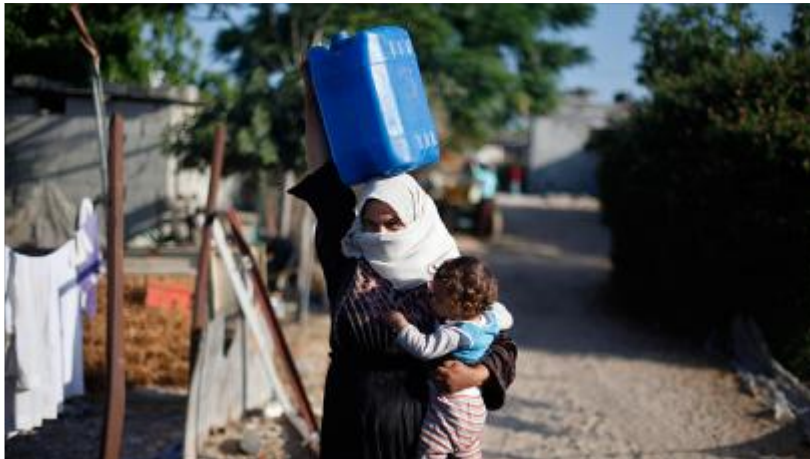
אישה עם ג'ריקן מים ברצועת עזה. ארכיון

בהתאם להנחיית רשות המים החלה "מקורות" לספק לרשות הפלסטינית חמישה מיליון מטר קוב מים נוספים לשנה בעבור תושבי רצועת עזה. בעקבות ההנחיה, תעמוד אספקת המים השנתית על 10 מיליון מטר קוב מים. מקור אספקת המים החדש ל-5 מיליון קוב לרצועת עזה הוא קו נחל עוז שבדרום. הקו השני והישן יותר נמצא באזור כיסופים ומספק מים למרכז הרצועה.